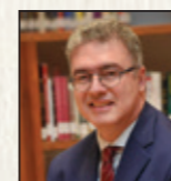
Καθηγητής Αριστείδης Σάμιτας Οικονομικών και Ανάπτυξης